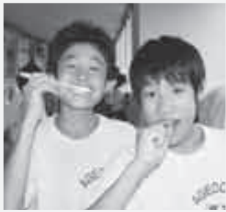
昼休みにみんなで歯磨き

大谷中では、給食後の昼休みに保健委員が中心になって呼び掛け、歯を磨いています。さらに学校歯科医の先生にご指導いただき、ことしも県学校歯科保健コンクールで4連覇を獲得することができました。生徒全員が歯を磨く意識が高く、自主的に歯を磨く人が多いです。 大谷中には「歯磨きは一生の財産 守る術」という標語があり、これを基に歯科コンクール5連覇を目指して毎日歯を磨いています。